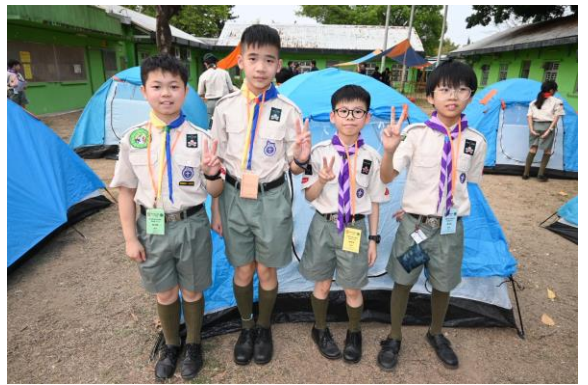
十八鄉區 幼童軍金紫荊獎章考驗營(營建)