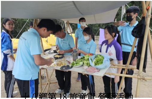
十八鄉第 18 旅童軍 營藝活動