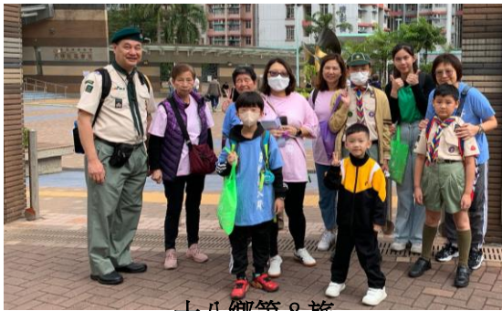
十八鄉第 8 旅