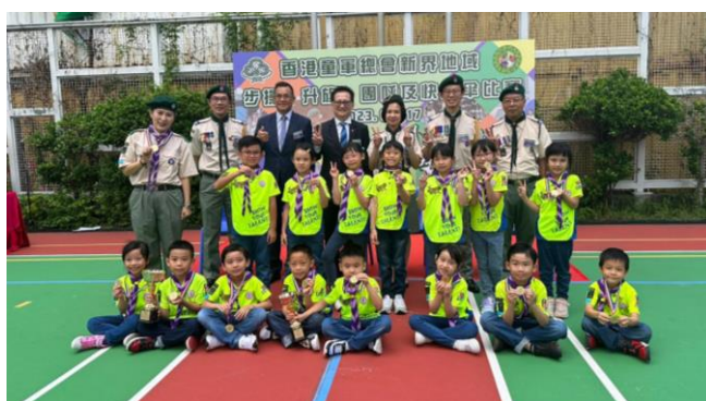
恭喜十八鄉第 21 旅在新界地域快樂傘比賽奪得冠軍