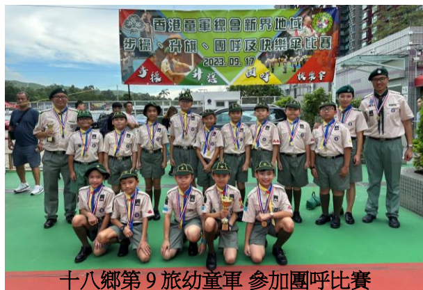
十八鄉第9旅幼童軍 參加團呼比賽