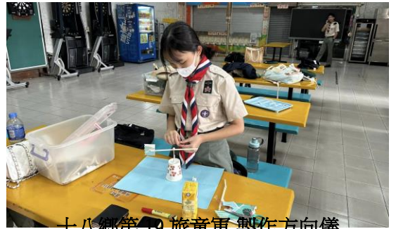
十八鄉第 19 旅童軍 製作方向儀