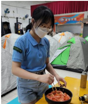
十八鄉第 19 旅童軍 校內露營活動