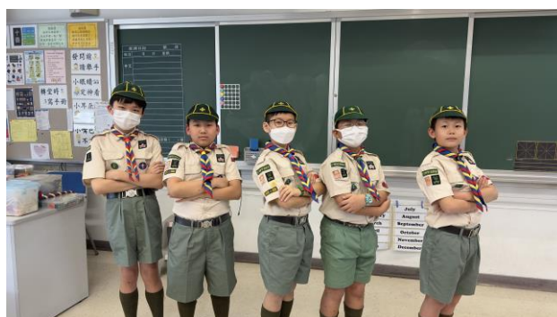
十八鄉第8旅幼童軍