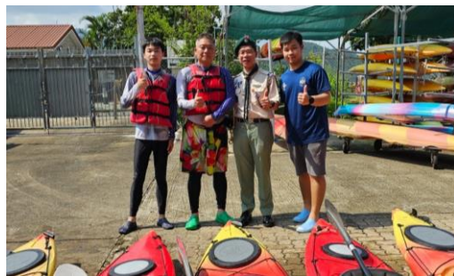
十八鄉第4旅 獨木舟活動