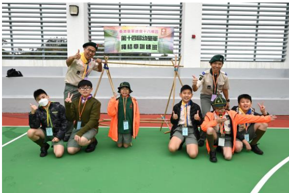
十八鄉區 幼童軍繩結訓練班