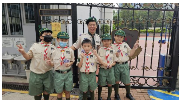
十八鄉第10旅幼童軍