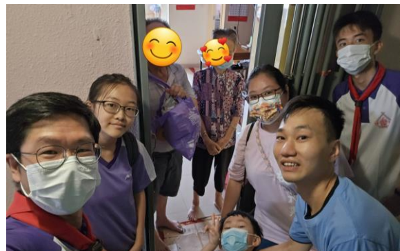
十八鄉第 18 旅