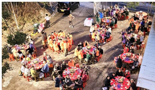
十八鄉第2旅 新春盆菜宴