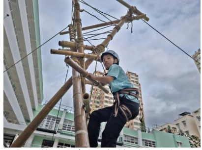
十八鄉區 童軍先鋒工程訓練班