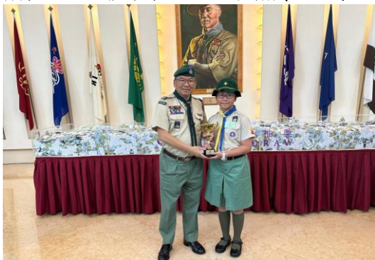
恭喜十八鄉第 9 旅在 2023 年度童軍獎券獲最佳獎券銷售童軍旅優異獎