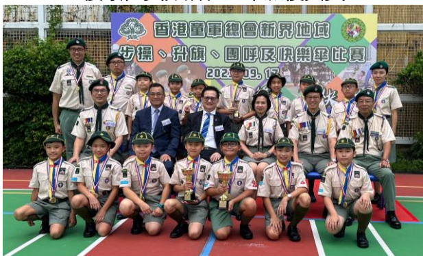
恭喜十八鄉第 9 旅在新界地域團呼比賽奪得冠軍