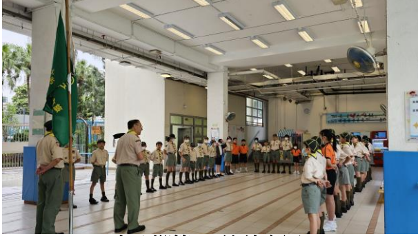
十八鄉第 16 旅幼童軍