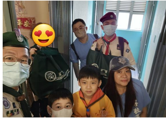
十八鄉第 18 旅及新界第 1654 旅