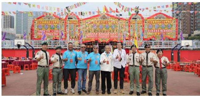
區領袖在十年一度的『元朗街坊十年例醮勝會』與 3 位前任區總監及現任區總監合照 (2023 年 12 月)