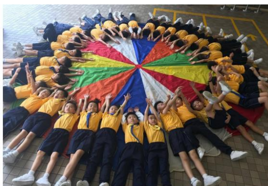
十八鄉第9旅小童軍