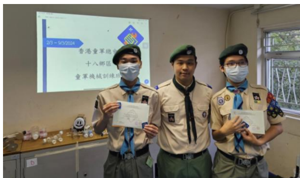
十八鄉第4旅童軍 參加機械訓練班