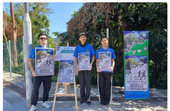
十八鄉第 22 旅 參加新界地域 65 週年 童競賽 · 越野挑戰賽