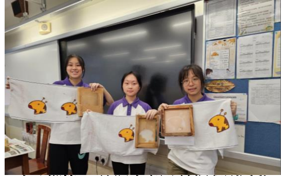
十八鄉第 18 旅深資童軍 絲網印刷活動