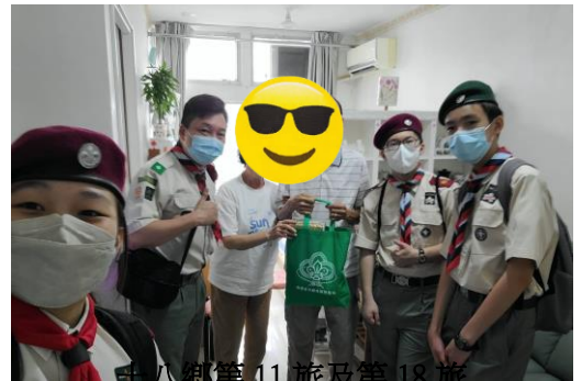
十八鄉第 11 旅及第 18 旅