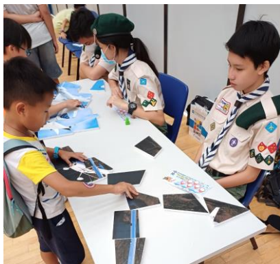
十八鄉第 22 旅 See Me Fly 航空體驗日