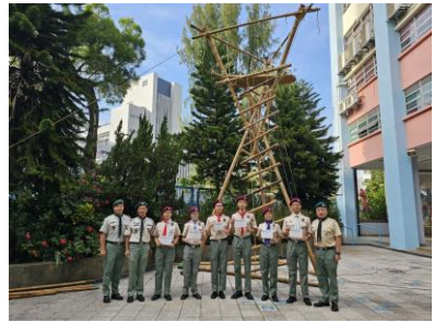
十八鄉區 深資童軍先鋒工程訓練班