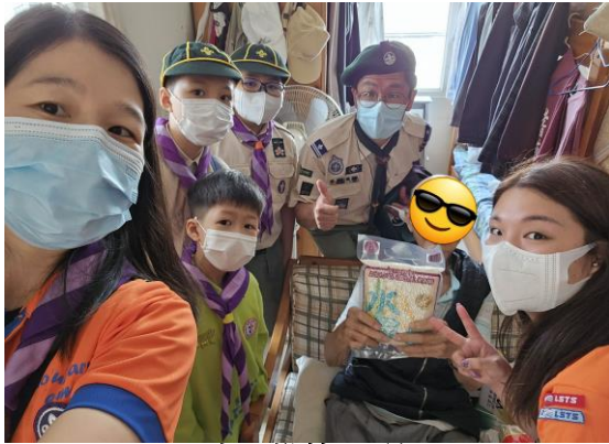
十八鄉第 21 旅