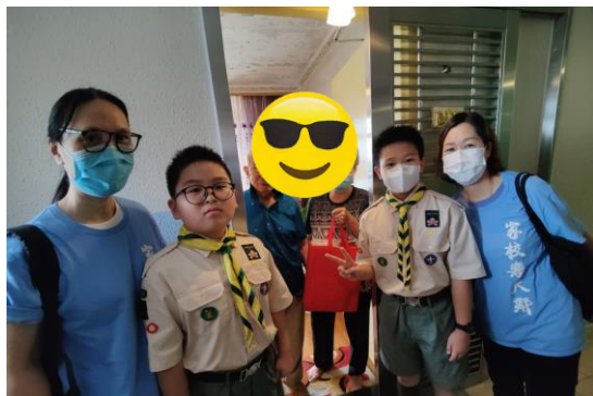
十八鄉第 16 旅