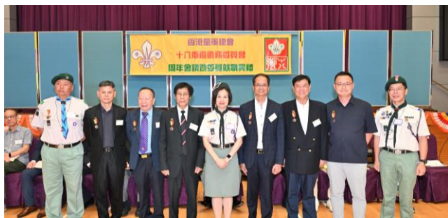
恭喜一眾委員及領袖獲長期服務獎章