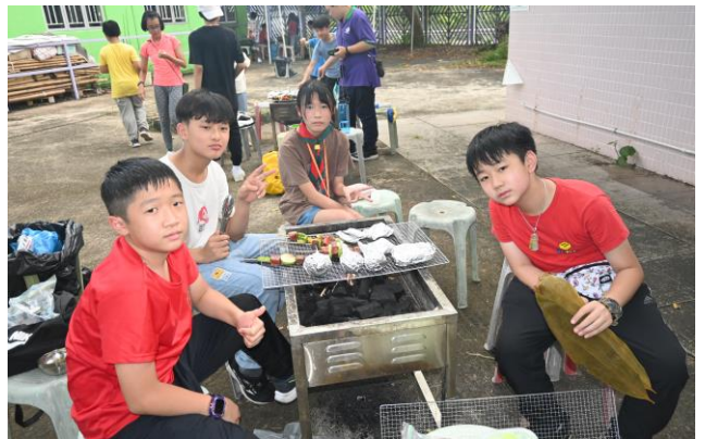
十八鄉區 幼童軍金紫荊獎章考驗營(原野烹飪)