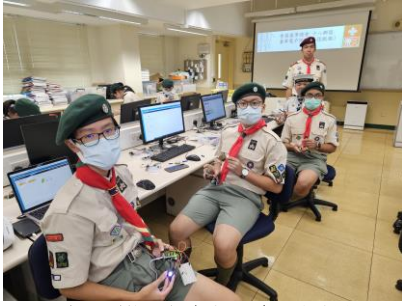
十八鄉區 童軍電子訓練班