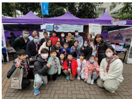
十八鄉第11旅 協助『元·遊匯』 18區日夜都繽紛活動