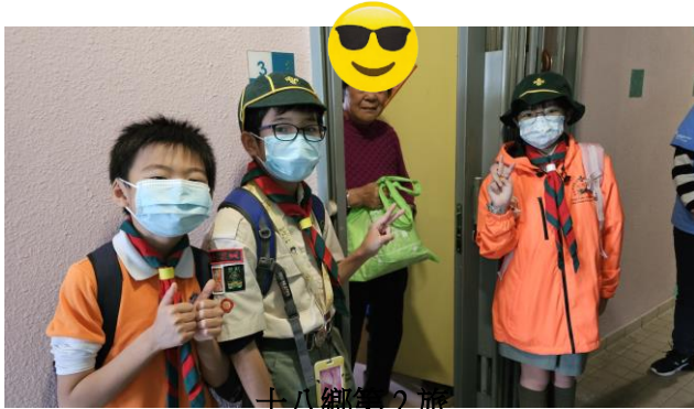
十八鄉第 2 旅