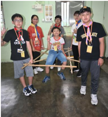
十八鄉區 幼童軍金紫荊獎章考驗營(製作)