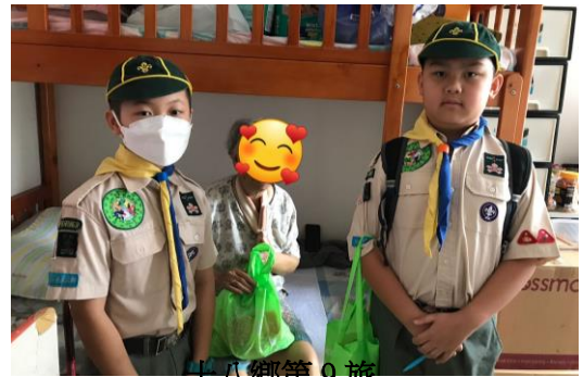
十八鄉第 9 旅