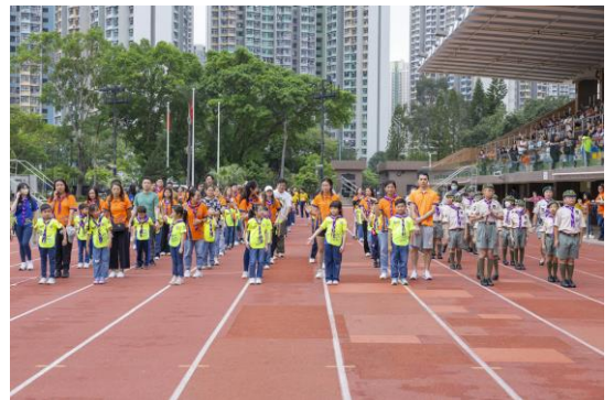
十八鄉第 21 旅小童軍及幼童軍