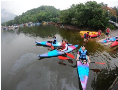
十八鄉區 童軍獨木舟訓練班