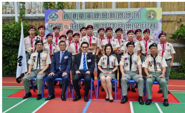
恭喜十八鄉第 18 旅在新界地域步操比賽奪得冠軍